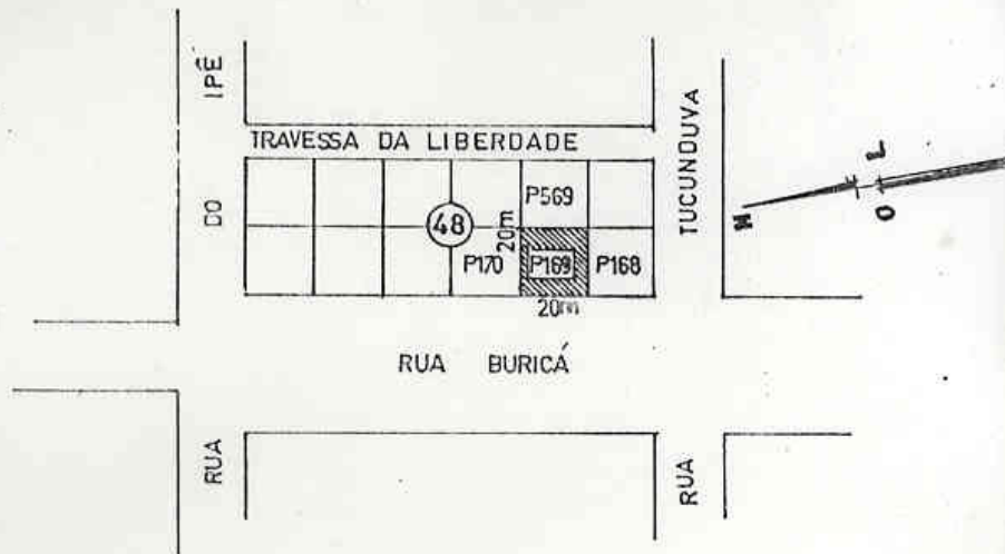
PLANTA DE LOCALIZAÇÃO escala 1:1.000